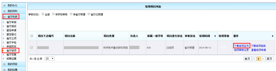
<结项证书下载示意图>

第四步：个人确认状态为【已结项】且结项时间和结项等级已填充，此时省厅审核通过，科研人员可以登录系统，如下图路径，点击【省厅结项】，在列表中蓝色按钮区下载结项书。