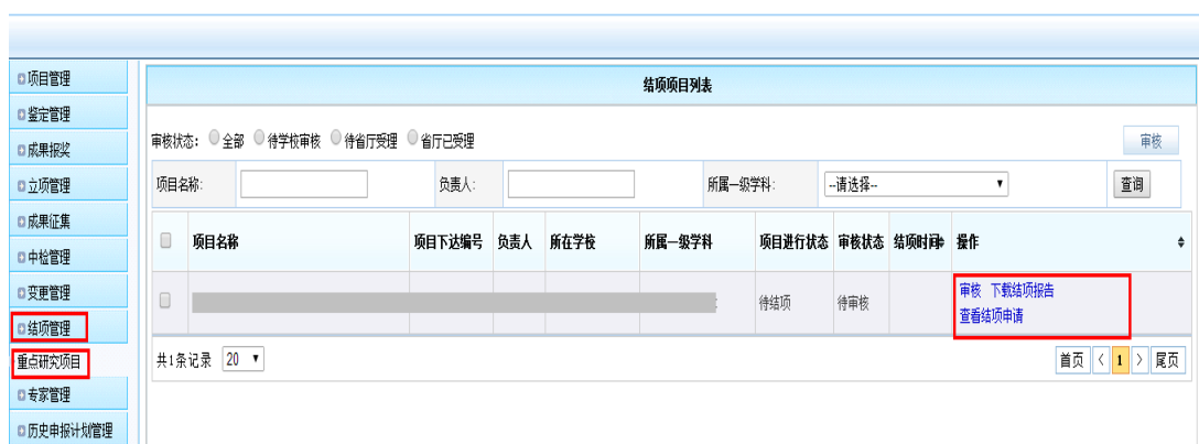
<高校管理员审核示意图>

管理员登陆后，目前只限超级管理员，点击【教育厅业务】→结项管理，在列表中审核结项信息。高校管理员审核通过的结项申请，会被递交到省厅管理员页面。在省厅管理员审核之前，高校管理员可以再次审核为不通过，项目负责人即可修改完善后重新提交结项申请。