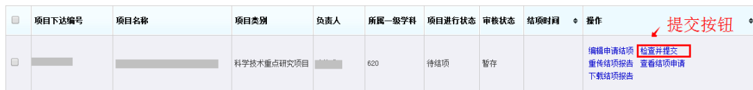
<结项材料上传示意图>